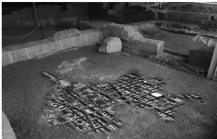
Estratigrafía . Imagen impresa sobre mosaico vítreo. 6m 2 .2010.

De esta forma se une una de sus principales preocupaciones, la utilización crítica de los nuevos medios con el espacio urbano y la temporalidad, uno de los elementos con los que viene trabajando desde los años ochenta a través de trabajos en video, net-art , instalaciones e imagen fotográfica.