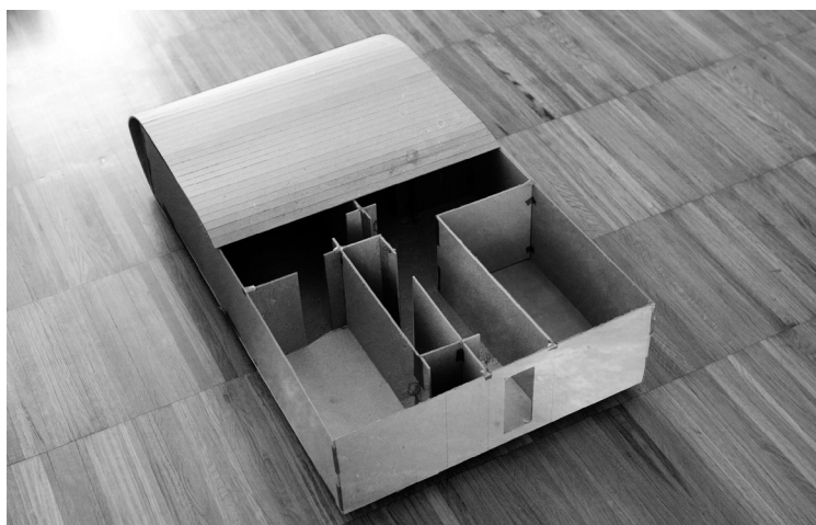
Sin título. Barro sin cocer, madera, tela de lino y yute. 30 x 110 x 170 cm. 2010

Se trata de componer una maqueta de su casa de la infancia, hoy en ruinas, para imbricarla dentro de otra ruina, la de la Villa, espacios ambos habitados, que en el polvo de sus estancias, conservan los restos de lo que fuimos y seremos, polvo sobre el suelo.